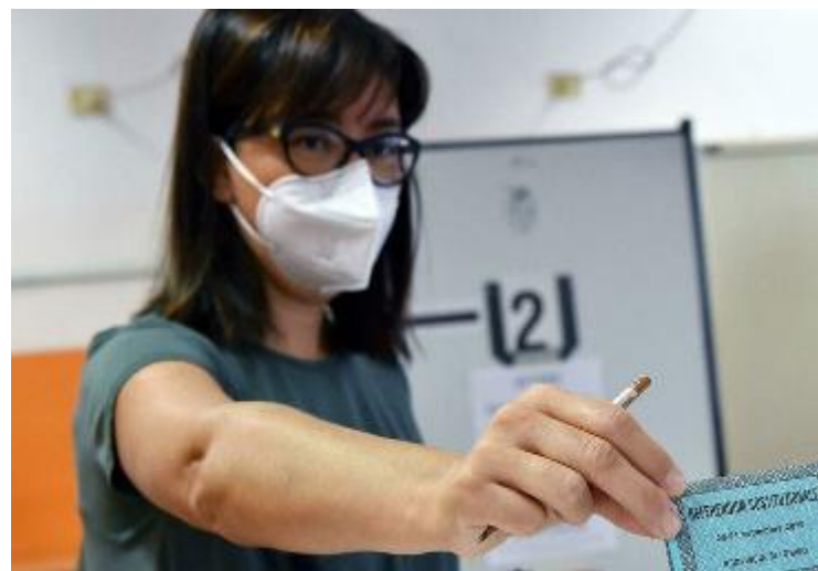
Un'elettrice imbuca la scheda dopo aver votato